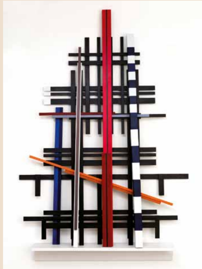
'Voices of Babel' • 2013 • geschilderd hout • 154 x 104 x 16 cm

Tijdens Kunstmoment Diepenheim op 20 oktober zullen Rotterdamse Kotomisi dansers optreden en als vraagbaak, aanwezig zijn in het hoofdgebouw van de Kunstvereniging bij de tentoonstelling 'KABRA: Descendants Exchange' van Remy Jungerman. Zij zullen nieuwsgierigen de geheimen van de getoonde voorwerpen ontvouwen.