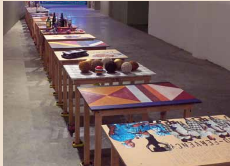
'Travelers Panama' • 2005-2013 • mixed media • 1800 x 81 x 97 cm

Dit jaar wordt overal in het land gevierd dat 150 jaar geleden de slavernij in de voormalige Nederlandse koloniën werd afgeschaft.