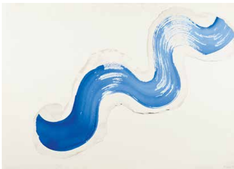
Cornelius Rogge • aquarel op dubbellaags papier • 70,5 x 100 cm • 1981