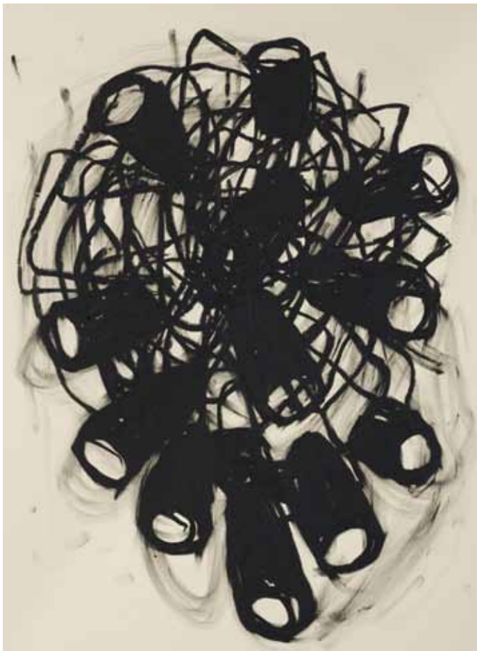
An Encyclopaedia of Memory and Slowness, 76 x 56 cm, oilstick op papier, 2008, Collectie SMS Reaal