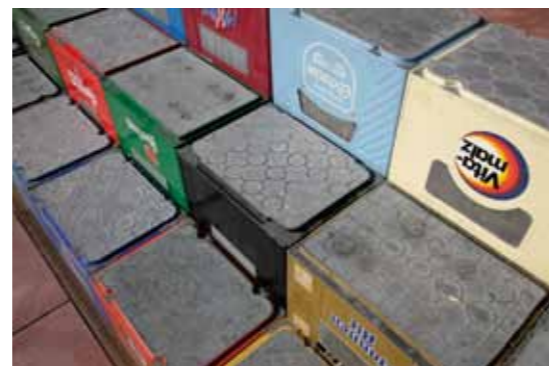
'Tribune van kratjes'