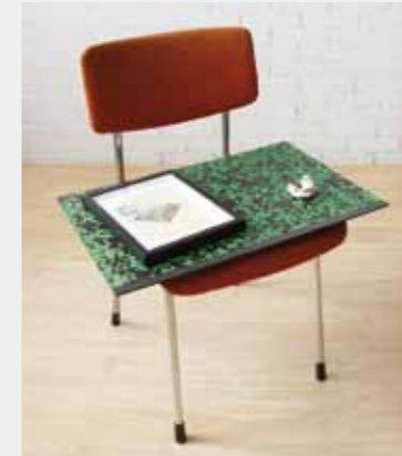
Zonder titel, 2012 stoel, tekeningenmap, tekening????

De ÈposPress Tekeningen Prijs is een initiatief van ÈposPress Zwolle in samenwerking met Drawing Centre Diepenheim en bestaat uit twee prijzen: één voor jong talent (tot 35 jaar) en één voor een kunstenaar (vanaf 45 jaar), die zijn/haar talent door de jaren heen als het ware onzichtbaar heeft bewezen.