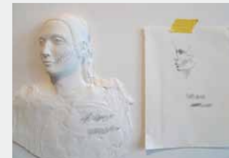
'And I began to forget where I came from', 2010 gips, potlood en papier