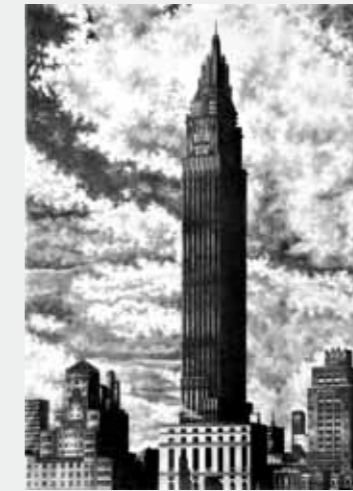
'The Colossus Building', 20?? potlood op papier