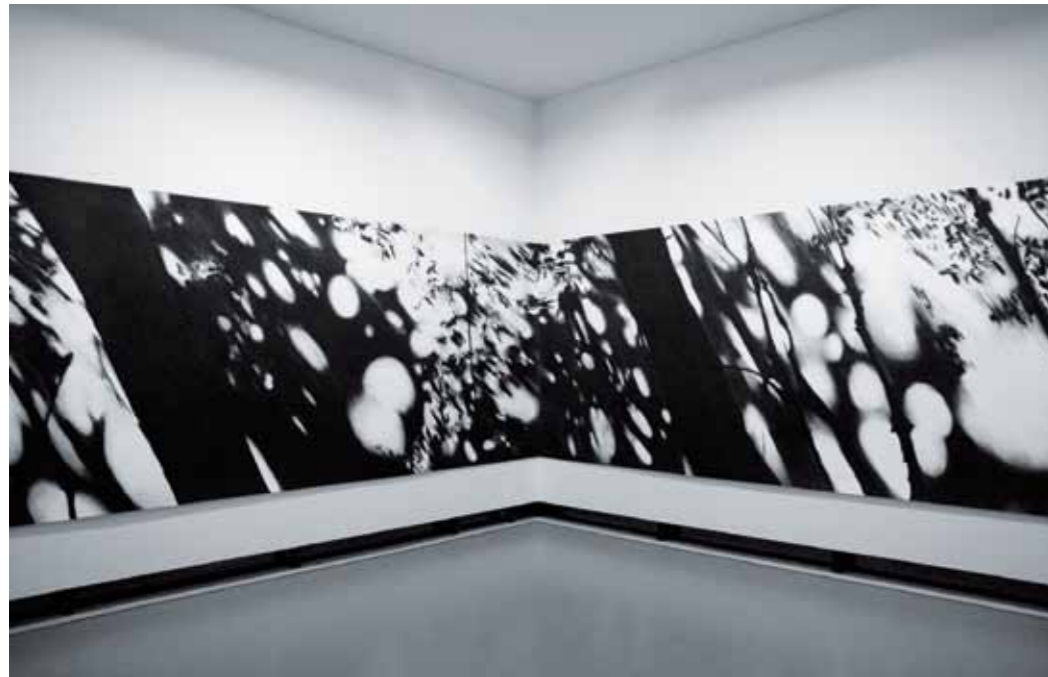
Carlijn Mens 'A Preserved Place, bos te Schoorl', 2011 houtschool op papier

Van het werk van Carlijn Mens is een litho te koop. Misschien wat anders formuleren + titel + afm etc