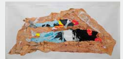
'You have to see this in a different light', 2012 potlood, inkt, acryl-inkt, acryl op papier

De relatie tussen religie en kapitalisme wordt uiteengezet in een omgeving van architectonische landschappen. Deze landschappen laten de contouren van een denkbeeldige stad zien. De buitenproportionele gebouwen herinneren ons aan de industriële utopieën die in onze fantasie zegevierden, maar faalden in het schenken van vrede en humaniteit in de werkelijkheid.