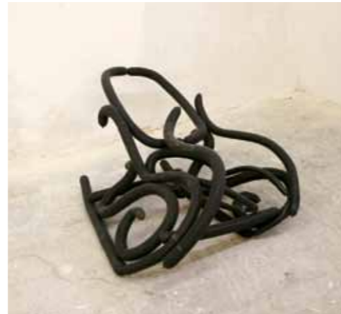
'Leeggelopen Thonet ballonstoel'