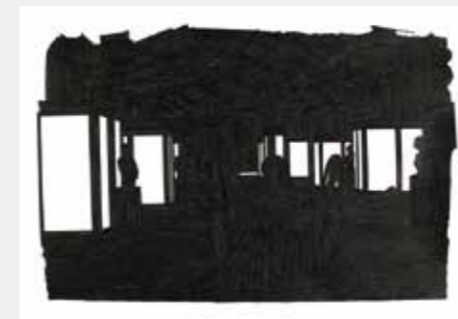
'Memoryoff#01', 2012 inkt op papier

Anatomische afbeeldingen uit oude boeken, stripverhalen, flora- en fauna-afbeeldingen en reproducties van modernistische werken van de eerste helft van de 20ste eeuw worden regelmatig geciteerd. Naast de verschillende technieken die Ben Kruisdijk hiervoor hanteert benut hij ook een divers scala aan media als drager voor zijn werken. Eén van de meest uitgesproken voorbeelden hiervan is zijn gebruik van röntgenfoto's om afbeeldingen in te krassen.