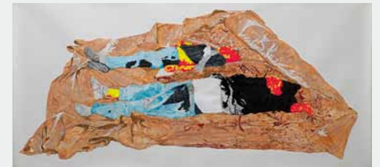
ÉposPress Tekeningen Prijs Justin Wijers 'You have to see this in a different light', 2012 potlood, inkt, acryl-inkt, acryl op papier