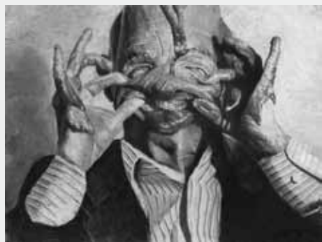
'Jeu d'enfants #1' • 160 x 150 cm • houtskool op papier • 2011 • privécollectie Parijs