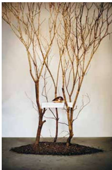
Joep Struyk • 'Lacrima' #14, Il sole al tramonto' marmar, brons en hout • 300 x 200 cm • 2014